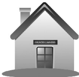
Disponível em: http://www.ama.pt/bde/anuncio_luminoso.html