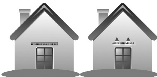
Disponível em: http://www.ama.pt/bde/anuncio_eletronico.html Disponível em: http://www.ama.pt/bde/anuncio_iluminado.html