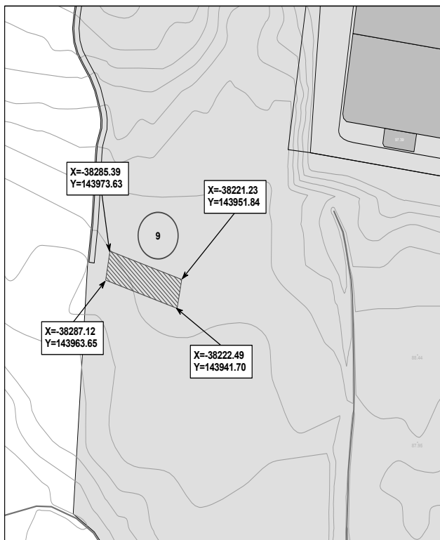
Planta de Localização

Requerente: Câmara Municipal de Snata Maria da Feira Freguesia: Rio Meão Rua: --- Lugar: ---