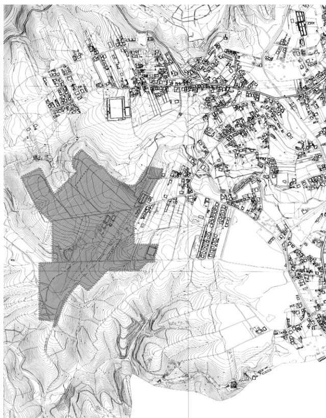
Área de intervenção do P. U. da Zona Industrial de Vale de Água Pinheiro da Bemposta