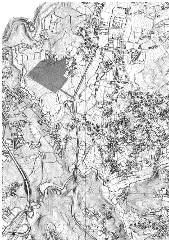
Área de intervenção do P. U. da Zona Industrial de Costa Má São Roque