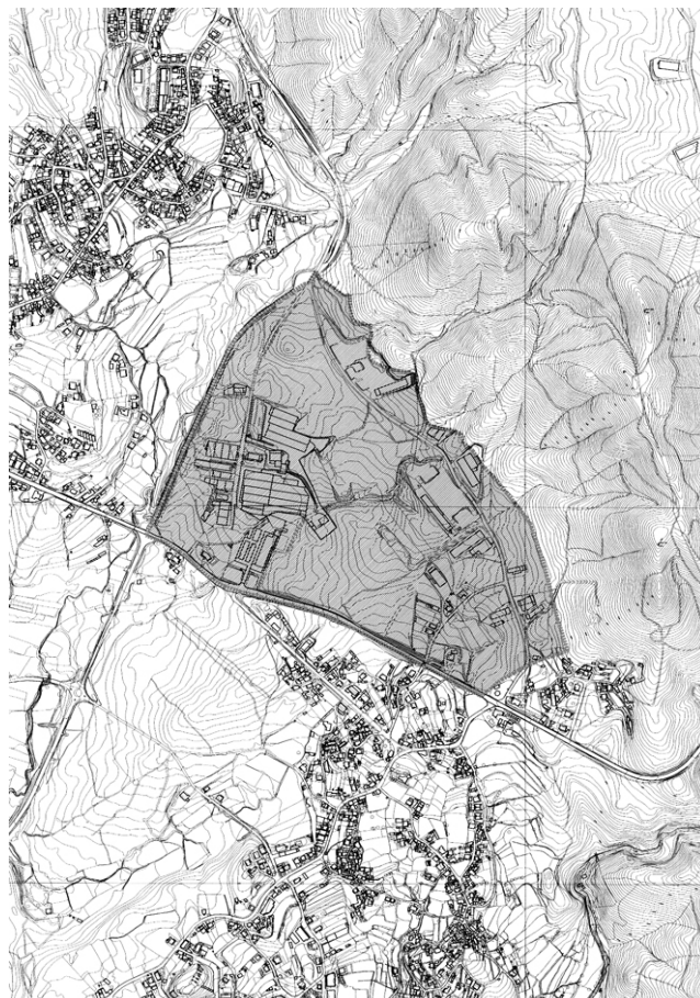
Área de intervenção do P. U. da Zona Industrial de Nogueira do Cravo/Pindelo