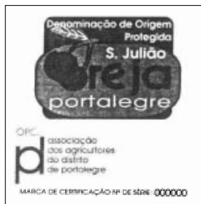
Cereja de S. Julião · DOP Marca de certificação 55 mm x 55 mm diâmetro