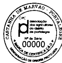
CASTANHA DE MARVÃO — PORTALEGRE · DOP Marca de certificação 25 mm diâmetro