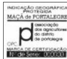
MAÇÃ DE PORTALEGRE · IGP Marca de certificação 30 mm x 25 mm