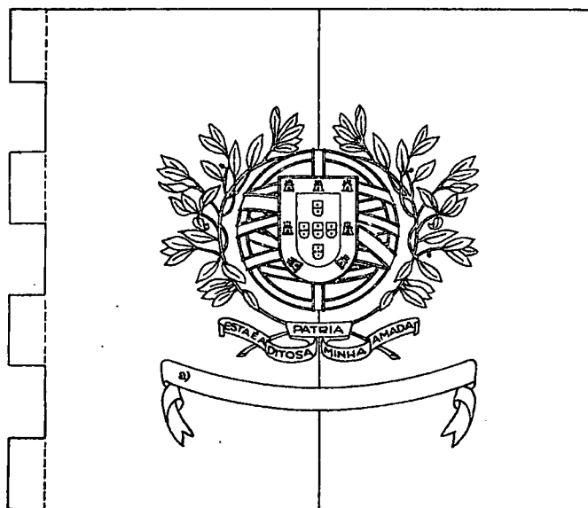
(a) Nome da unidade.